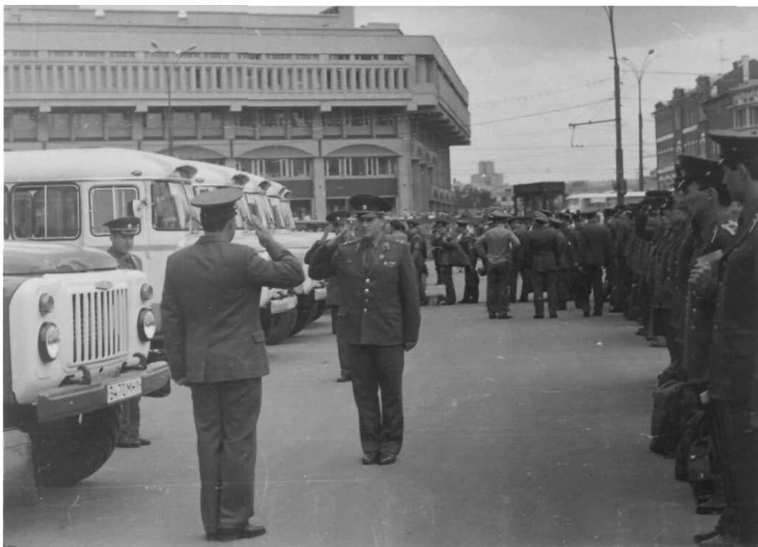
Специальный батальон перед отъездом в г. Баку. г. Москва. 1989 г.

МВД СССР и МВД России в трагические для страны дни событий в Баку в 1989 г., в Нагорном Карабахе в 1990 г., в Москве в августе 1991 г., в октябре 1993 г.