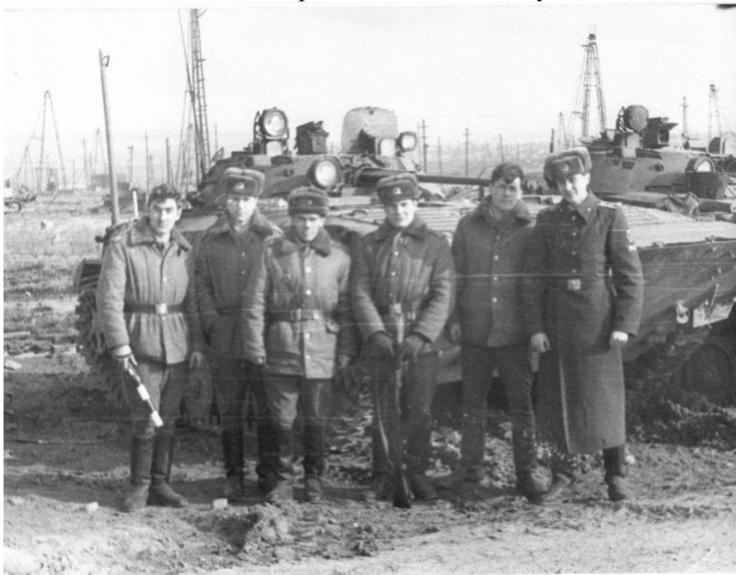
Сотрудники Ивановского пожарно-технического училища на заставе. Азербайджан, 1989